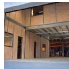
Lagerbühne mit Räumen oben und unten