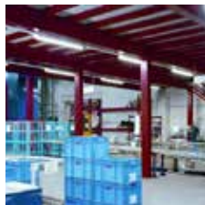
Lagerbühne mit Kommissionierplätzen