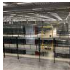
Dreigeschossige Lagerbühne mit Fachbodenregalen und Übergabestationen