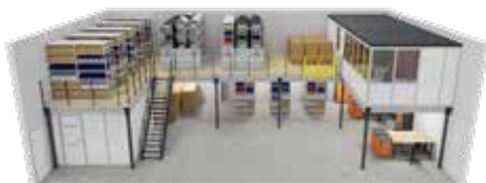
Mit BERGER Lagerbühne, Sozialraum und Hallenbüro