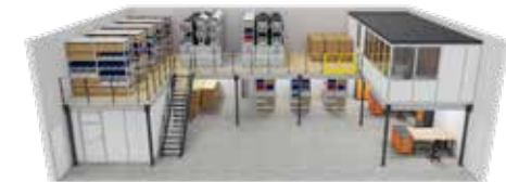
U-Bühne zusätzlich mit Verschiebe-Reifenregalen Rolling-BERT