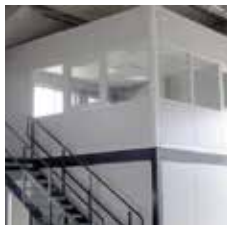
Lagerbühne mit Hallenbüro