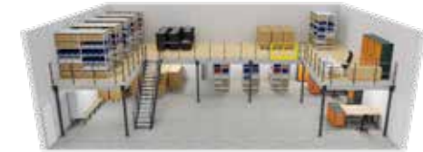
U-Bühne zusätzlich mit Arbeitsplatz auf der Bühne und Spinden unter der Bühne.