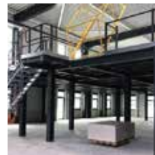
Lagerbühne mit Übergabestation und gerader Treppe