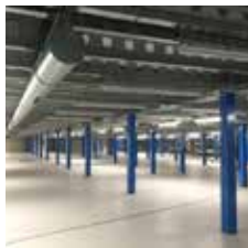
Lagerbühne mit ESD Belag