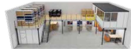
U-Bühne zusätzlich mit Hallenbüro auf der Bühne und Sozialraum unter der Bühne