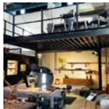
Lagerbühne im Showroom mit Arbeitsplätzen