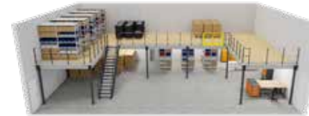
U-Bühne mit gerader Treppe